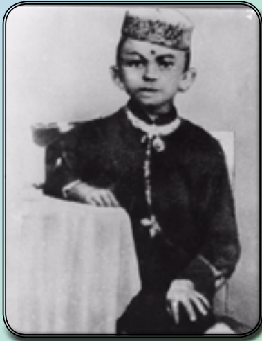
Mahatma Gandhi op 7-jarige leeftijd

Op 2 oktober 2019 zal het 150 jaar geleden zijn dat Mohandas Karamchand Gandhi als jongste zoon werd geboren in Porbandar, een havenplaatsje aan de Arabische Zee in de huidige provincie Gujarat. Naar Indiase maatstaven was zijn familie welgesteld. Zowel zijn grootvader als zijn vader waren minister van de koninklijke staat Porbandar en behoorden tot een kaste die bekend stond om haar (inter)nationale handelsgeest. De kooplieden dank(t)en hun commercieel succes aan hun eenvoudige levenswijze. Zijn naam betekent ‘handelaar in parfum of kruiden’. Gandhi werd grootgebracht volgens de ideeën en gebruiken van de Hindoe-religie. Roken, het eten van vlees en het drinken van alcohol waren niet toegestaan. Er was niets bijzonders aan de jonge Mohandas, behalve misschien dat hij heel verlegen, onzeker en ernstig was. Hij had geen bijzondere talenten en bleef op school wat onder de middelmaat. Niets liet vermoeden dat “komende generaties nauwelijks zouden kunnen geloven dat iemand als hij ooit in levende lijve hier op aarde is geweest” , dixit Albert Einstein.