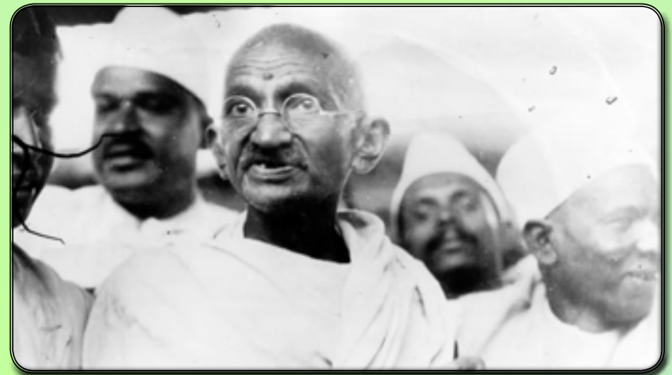
Gandhi leading the Salt March in protest against the government monopoly on salt production.